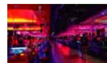
Lugares de entretenimiento